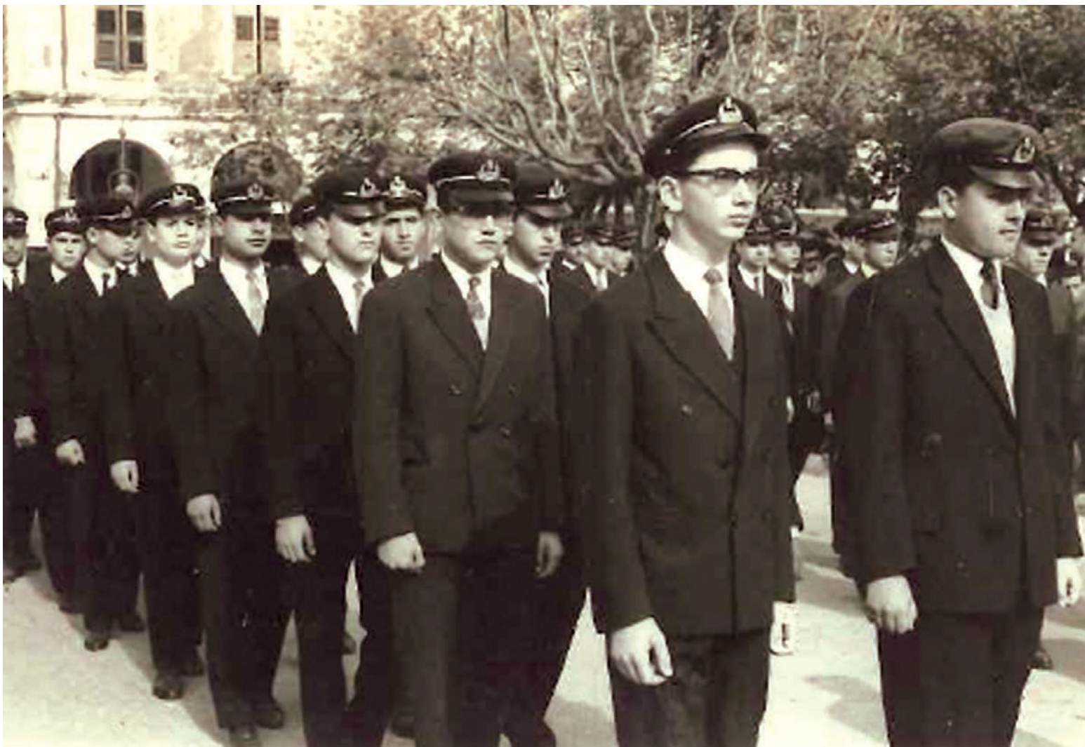
Εικόνα 11. Μαθητές του 2 ου Γυμνασίου Αρρένων Κέρκυρας κατά τη διπλωματία του Αγίου Σπυρίδωνος το Μ. Σάββατο, 1960.

ζεται - κατά την πιο ξέγνοιαστη περίοδο (θερινές διακοπές) και σ' ένα υπέροχο φυσικό περιβάλλον - με κοινή διαβίωση, κοινή τράπεζα, κοινή ψυχαγωγία, κοινή ανάληψη υποχρεώσεων και δραστηριοτήτων, κοινή ζωή και κοινή Λατρεία.