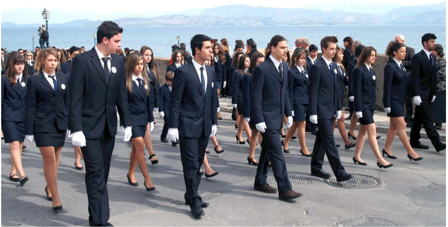
Εικόνα 12. Μαθητές και μαθήτριες κατά τη διπάνευση του Ι. Σκηνώματος της Αγίας Θεοδώρας της Αυγούστης την Κυριακή της Ορθοδοξίας στην Κέρκυρα, 2011.

του Πρωτοκύριακου (2.11.1941), αμέσως μετά την καθιερωμένη Λιτανεία του σκηνώματος του Αγίου Σπυρίδωνος στην Κέρκυρα. Μια περίπου δεκαπενταετία αργότερα (1955-1959), θα διεξαχθεί ο εθνικός Αγώνας της κυπριακής νεολαίας (Ε.Ο.Κ.Α.) κατά της Αγγλοκρατίας στην άλλη εσχατιά της Ρωμιοσύνης, τη μαρτυρική μεγαλόνησο Κύπρο. Τόσο οι νέοι της Κέρκυρας, όσο και τα αδέρφια τους της Κύπρου, εμφορούνται από τις ίδιες Αρχές με σημαντικότερη την προάσπιση της εθνικής Ελευθερίας, απότοκα κυρίως της ευρύτερης εκκλησιαστικής παιδείας που απέκτησαν.