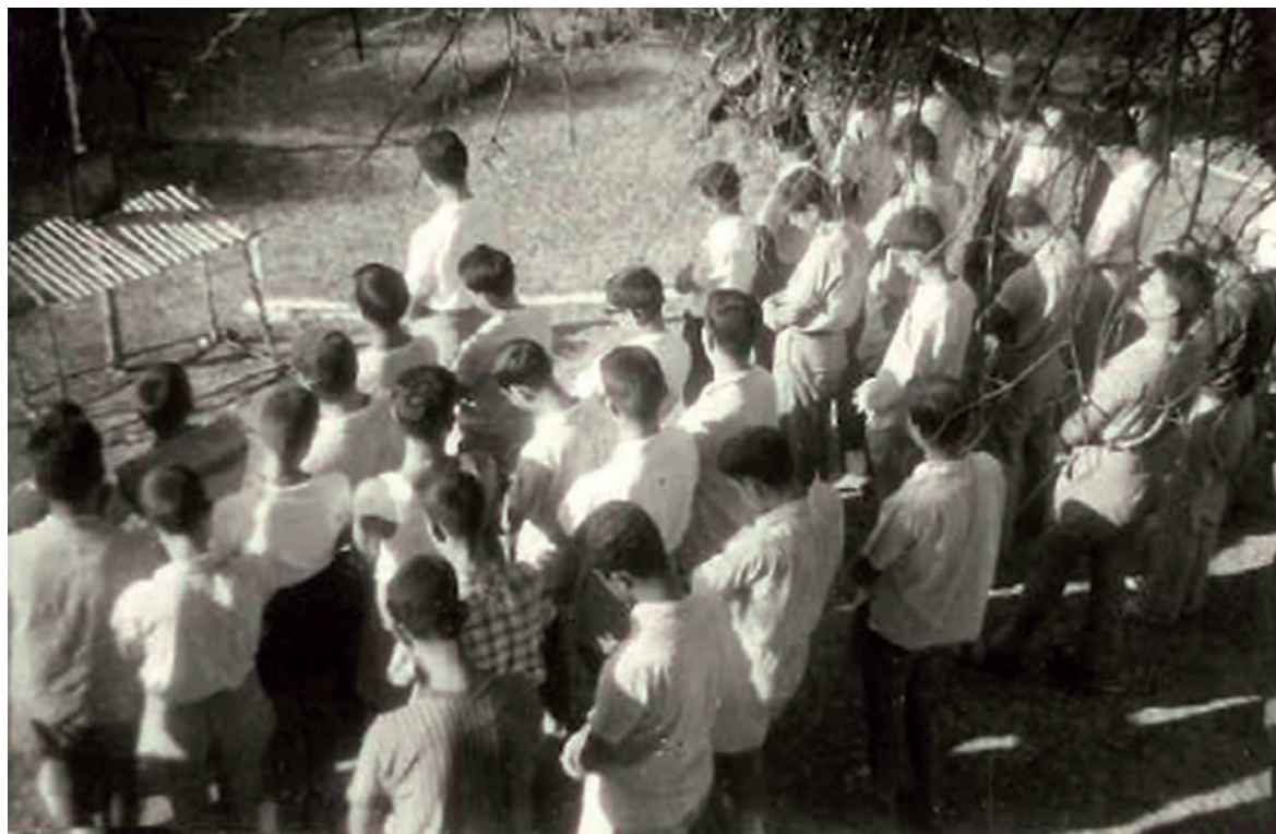
Εικόνα 9. Πρωινή προσευχή στην κατασκήνωση.

κών. Η Εκκλησία της Ελλάδος, προκειμένου να οργανώσει σε δικές της δομές το κατηχητικό και ευρύτερο πνευματικό της έργο, ίδρυσε το 1936 την «Αποστολική Διακονία», η οποία αναμορφώθηκε μεταπολεμικά (1946). Πρόεδρος του διοικητικού της συμβουλίου είναι ο εκάστοτε Αρχιεπίσκοπος Αθηνών, ενώ στα μέλη της μετέχουν συνοδικοί μητροπολίτες και ακαδημαϊκοί θεολόγοι. Κατ' επέκταση κάθε Μητρόπολη σταδιακά ανέπτυξε το δικό της ιδιαίτερο έργο αναφορικά με τη νεότητα και την κατάχυσή της, δράση που συνεχίζεται στηριζόμενη κυρίως σε εμπνευσμένους κληρικούς και λαϊκούς εθελοντές, που στελεχώνουν το νεανικό έργο της Εκκλησίας σε κάθε περιοχή της πατρίδας μας. Μετά την παραχώρηση από το Οικουμενικό Πατριαρχείο στην Εκκλησία της Ελλάδος των Μητροπόλεων και Επισκοπών των Ιονίων Νήσων, με την Πατριαρχική και Συνοδική Πράξη του 1866, 30 συνακόλουθη ήταν η επίδραση των ποιμαντικών και κατηχητικών πρακτικών της