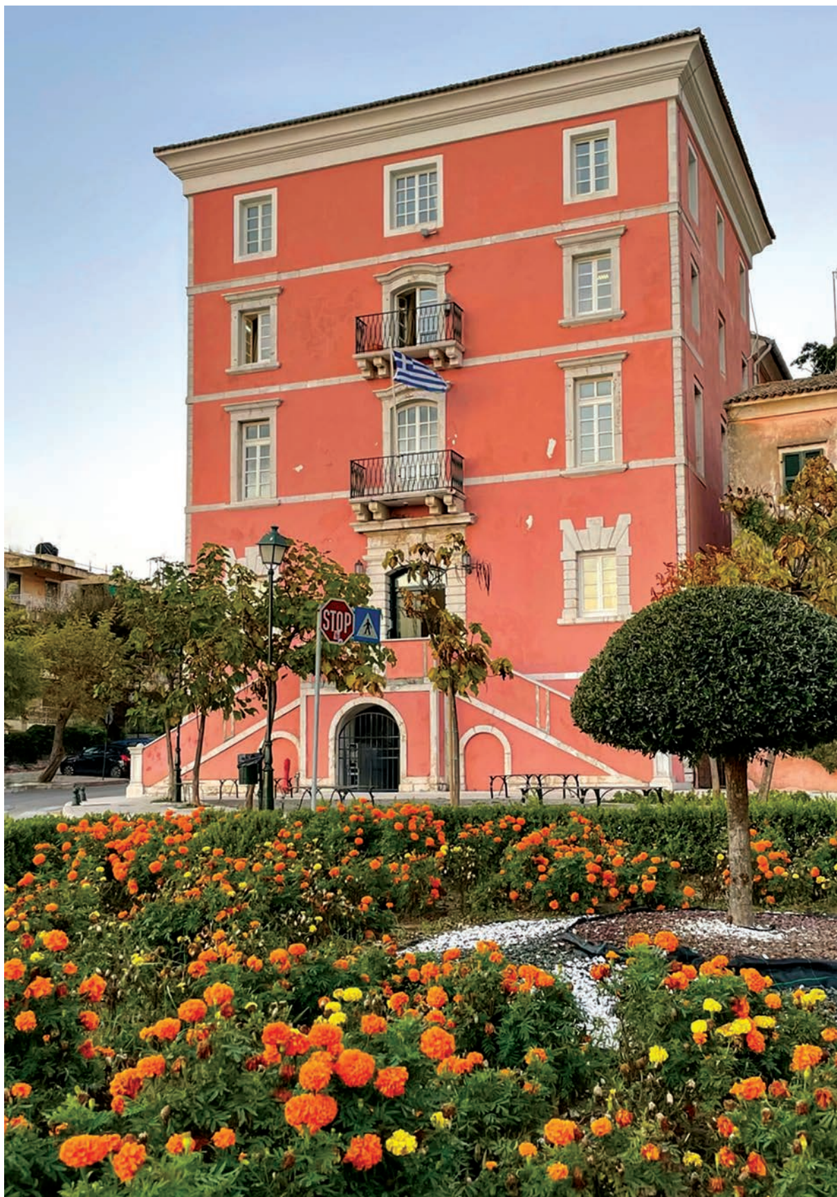
Εικόνα 2. Ιόνιος Ακαδημία.