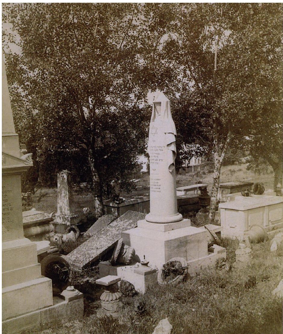
Εικόνα 5. Βανδαλισμοί στο Εβραϊκό νεκροταφείο, 1891.