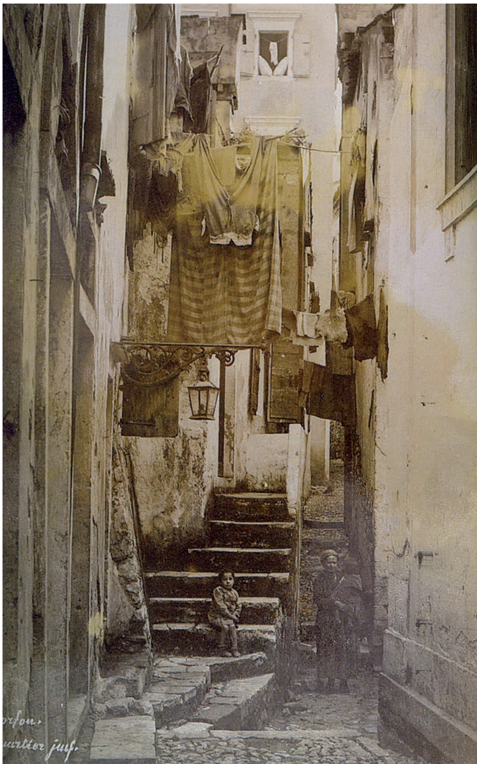
Εικόνα 4. Εβραϊκή συνοικία, 1800.

και η οικονομική τους δραστηριότητα δεν φαίνεται να περιορίζεται σημαντικά ενώ μονοπωλούν το λιανικό εμπόριο ανάμεσα στα νησιά.