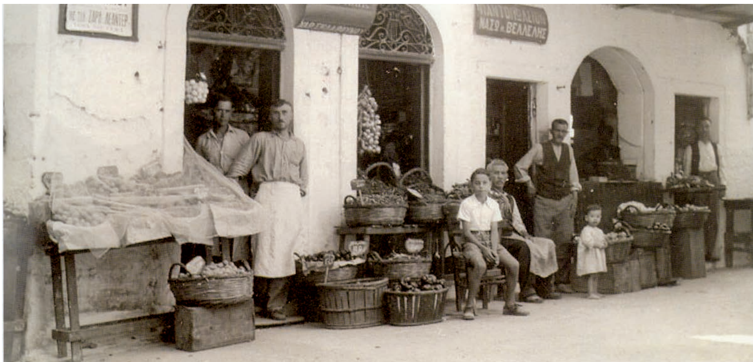
Εικόνα 8 και 9. Μαγαζιά Εβραίων και Χριστιανών στην Εβραϊκή συνοικία.