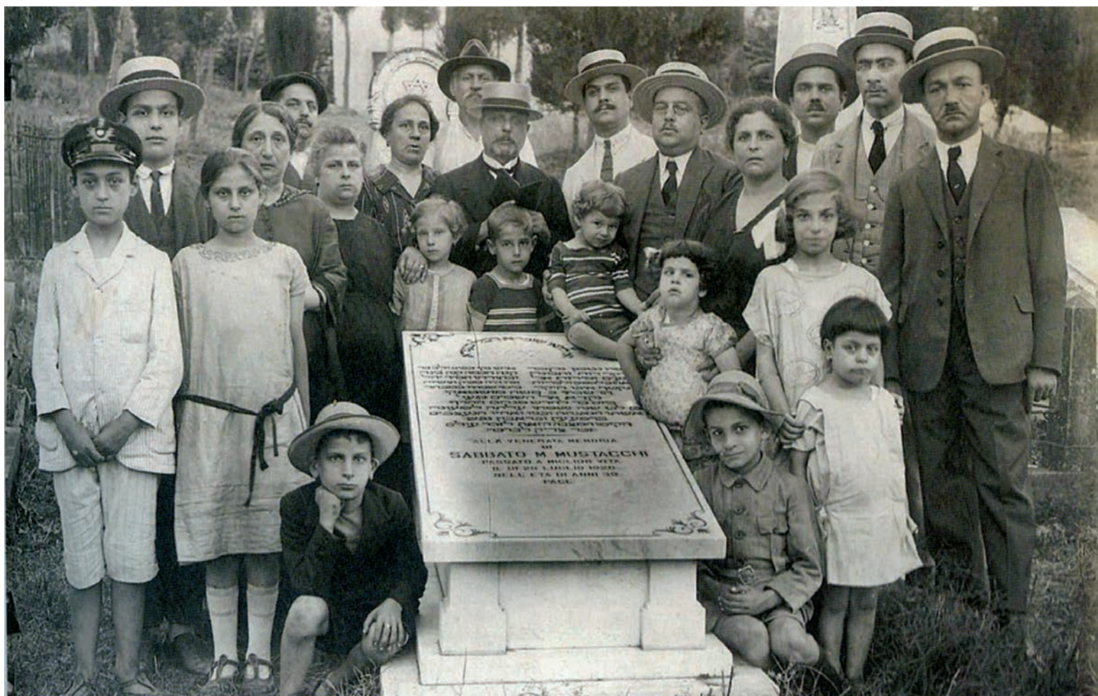
Εικόνα 12. Κερκυραϊκές Εβραϊκές οικογένειες πριν από τον πόλεμο.

σα, Θρησκευτικά, Ελληνική Γλώσσα, Ιστορία, Γεωγραφία, Φυσική Ιστορία, Φυσική και Χημεία, Αριθμητική, Γεωμετρία, Ιχνογραφία, Καλλιγραφία, Χειροτεχνία, Ωδική και Γυμναστική.