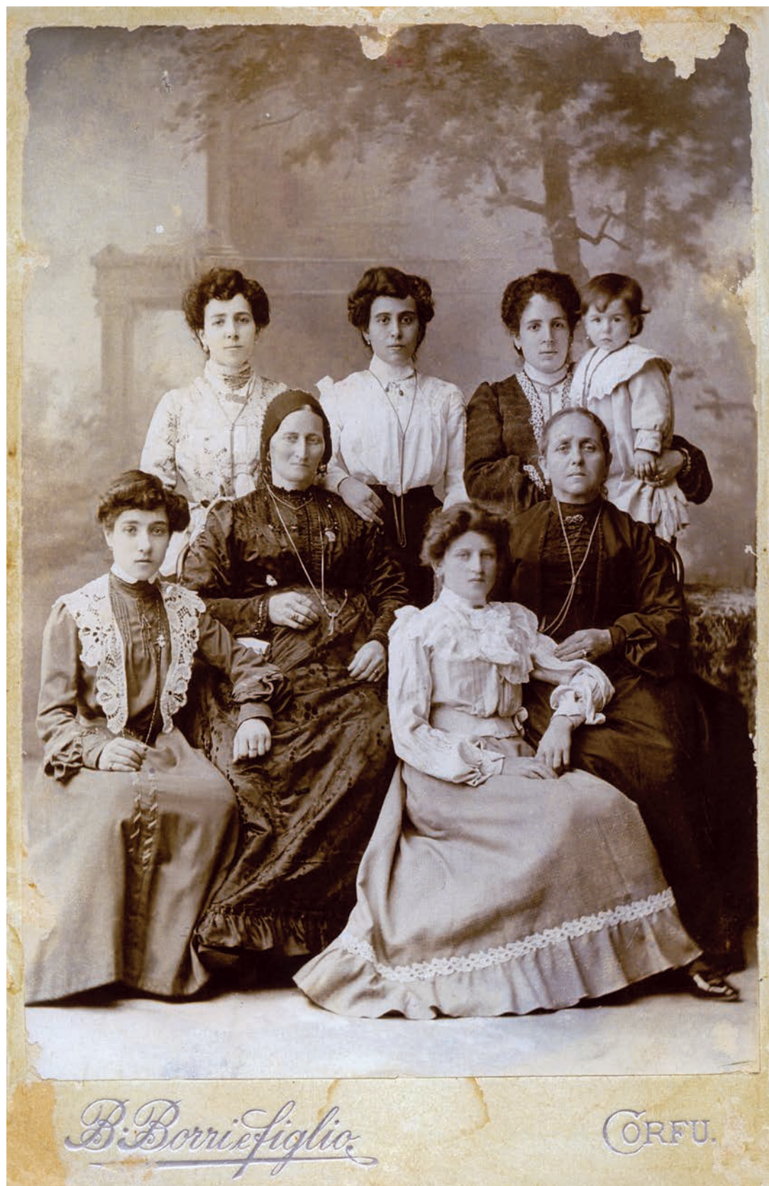
Εικόνα 10. Κερκυραϊκές Εβραϊκές οικογένειες πριν από τον πόλεμο.