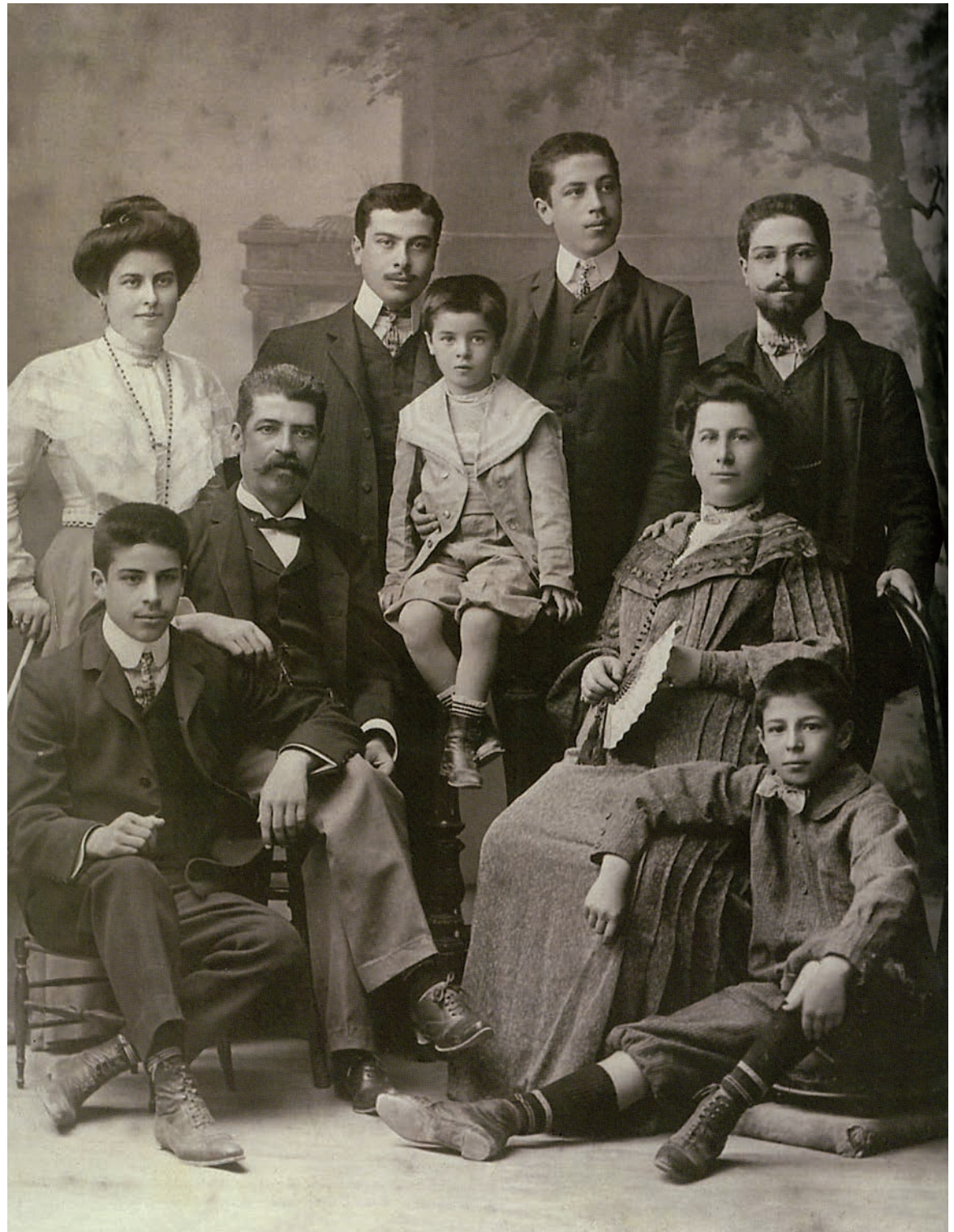
Εικόνα 11. Κερκυραϊκές Εβραϊκές οικογένειες πριν από τον πόλεμο.